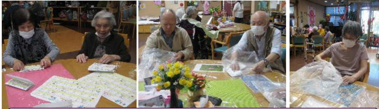
利用者の皆様にもお手伝い頂きました。ありがとうございます♪