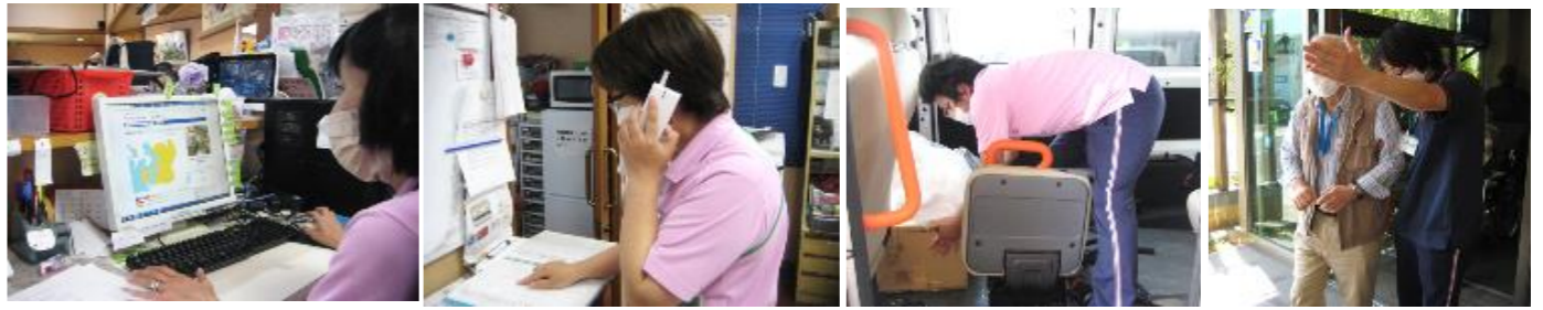
①情報収集 ②利用者家族へ連絡 ③備品の乗せこみ ④避難誘導

当苑では、2年前より水害における避難確保計画を作成した上で人員体制の確保、避難経路の確認を行い、水害避難訓練を行っております。