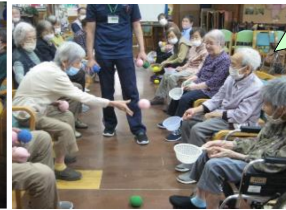
ボール入れゲーム