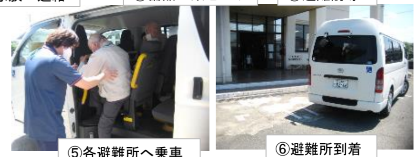
⑤各避難所へ乗車 ⑥避難所到着

★★編集後記★★ 暑い日が続きます※ 室内でも脱水・熱中症にならないよう水分をこまめに摂取しましょう!