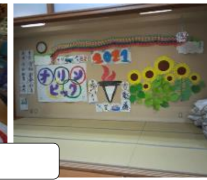
東京オリンピック2020