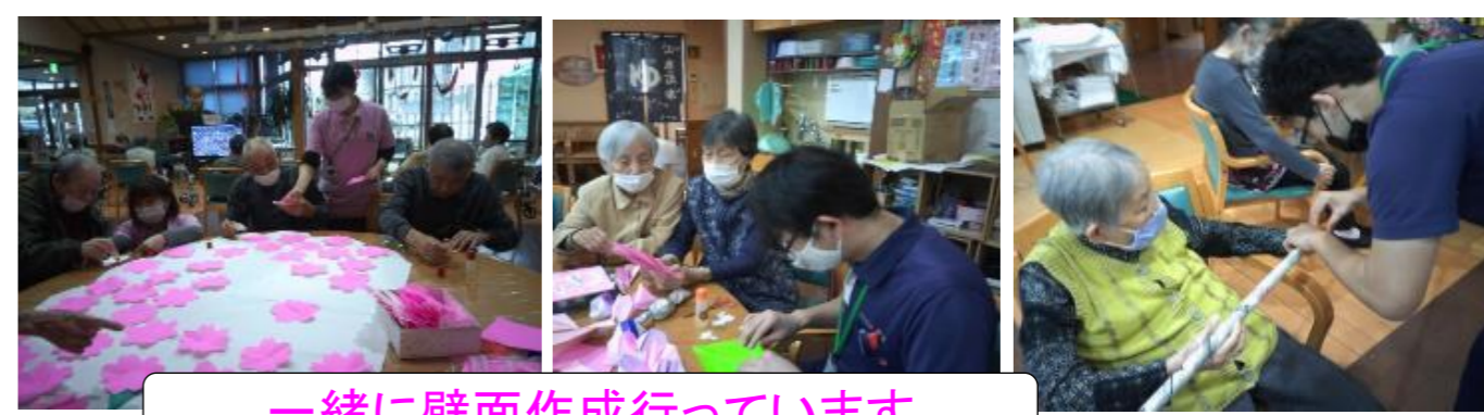
一緒に壁面作成行っています