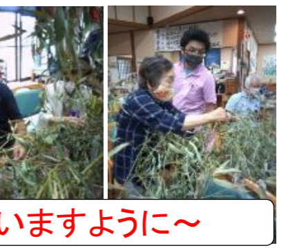
七夕～皆さんの願い事が叶いますように～