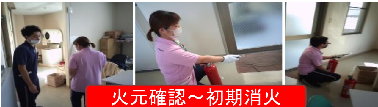
火元確認～初期消火